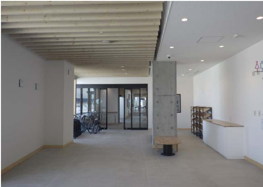
24時間休憩スペース