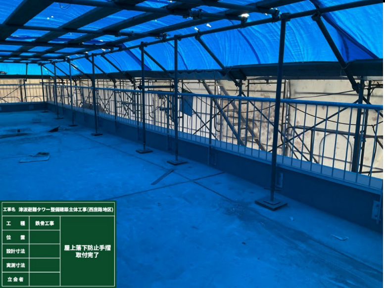
工事名 津波避難タワー整備関係主体工事(西成路地区) 工種 鉄骨工事 屋上落下防止手摺 取付完了 位置 設計寸法 実測寸法 立会者