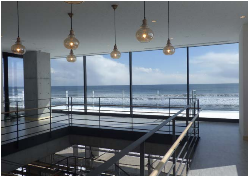
屋内展望スペース