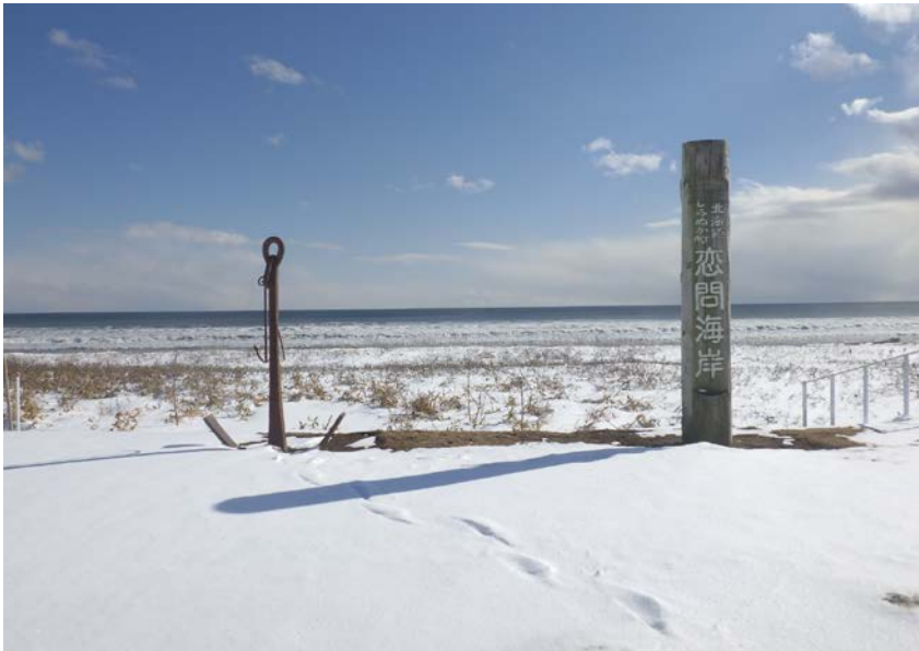
旧モニュメント移設