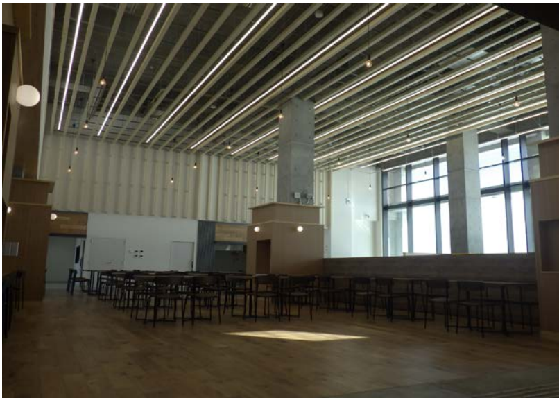
無料休憩・飲食コーナー