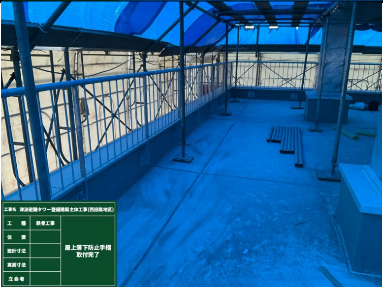
工事名 津波避難タワー整備関係主体工事(西成路地区) 工種 鉄骨工事 屋上落下防止手摺 取付完了 位置 設計寸法 実測寸法 立会者