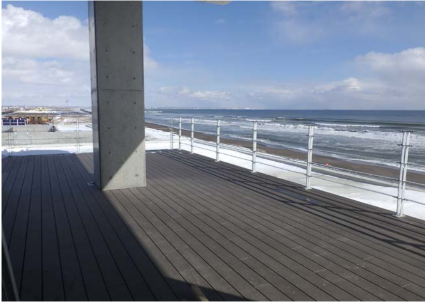
屋上展望スペース