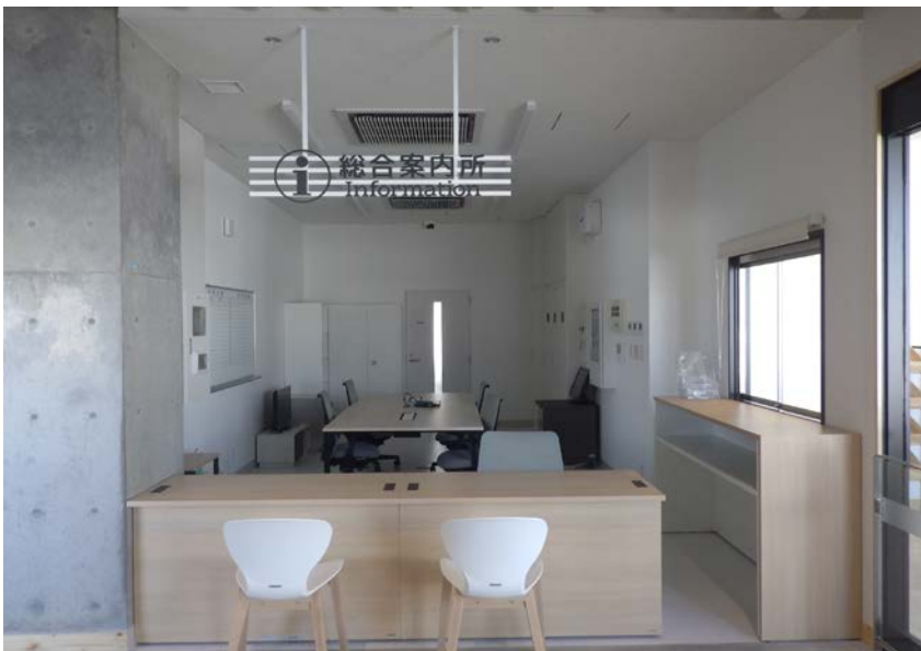
観光インフォメーション