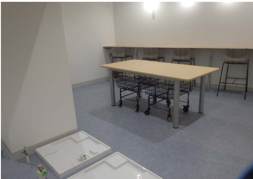
コインランドリー